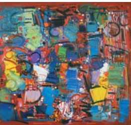
ALDO POGLIANI 1936