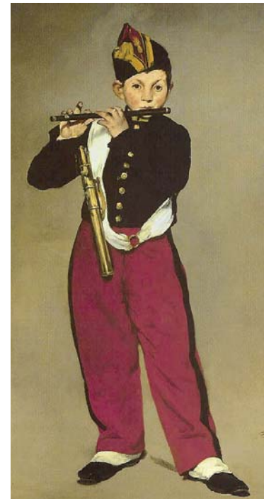
Le Fife de Manet

17.30 Uhr Vesperkonzert in der Französischen Kirche St.Moritz Bad