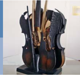
NICKI DE SAINT PHALLE 1929-2001