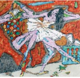
ALOIS CARIGIET 1902-1985

im Kempinski Grand Hôtel des Bains St. Moritz