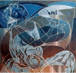
HANS ERNI 1909